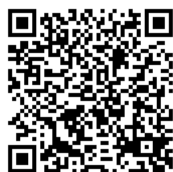
大野市ホームページ