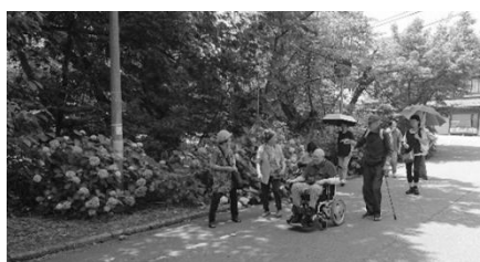
あじさい鑑賞しながら神社へ